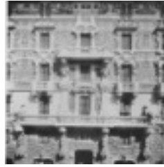
Palazzo Zuccarino 1906-1907 via Maragliano 2