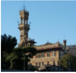
Castello Mackenzie 1896-1906 via C.Cabella 15