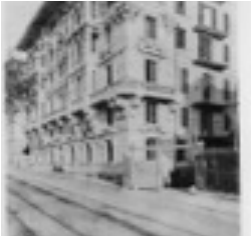
Palazzo Bogliolo 1906 corso Firenze 9