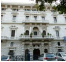
Palazzo Pastorino 1906-1910 via B.Bosco 57