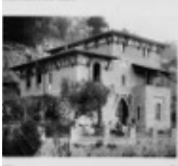
Villa Dellepiane 1904-1905 via privata Piaggio 33